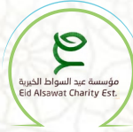
عيد السواط الخيرية